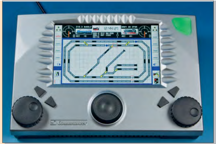
Aufnahmen: Frank Zarges, Ralph Zinngrebe Titel: Frank Zarges, Ralph Zinngrebe